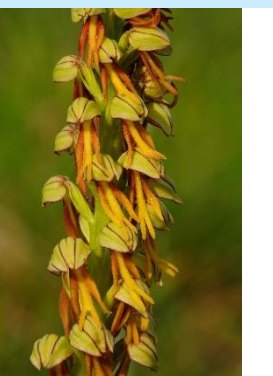
Orchis homme-pendu ( Orchis anthropophorum )