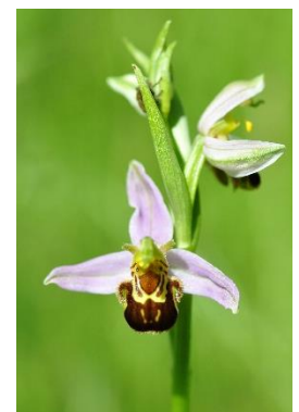
Ophrys abeille ( Ophry apifera )