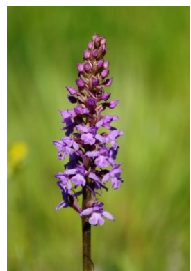
Orchis moucheron ( Gymnadenia conopsea )