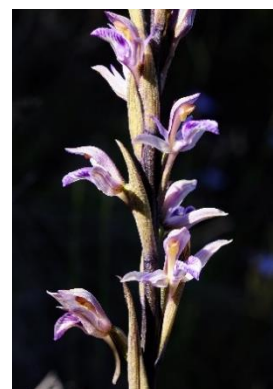
Limodore à feuilles avortées ( limodorum abortivum )