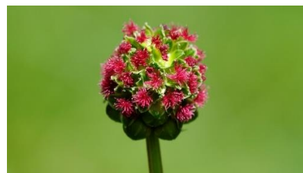
Pimpinelle, petite sanguisorbe ( sanguisorba minor ) ▶