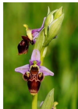
Ophrys bécasse ( Ophry scolopax )