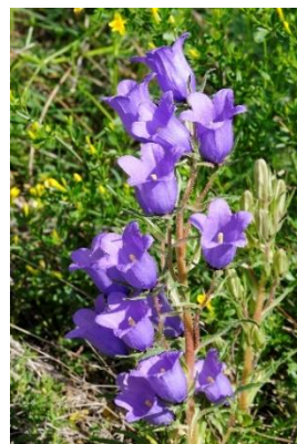
Campanule remarquable ( Campanule speciosa )