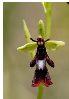
Ophrys mouche ( Ophrys insectifera )