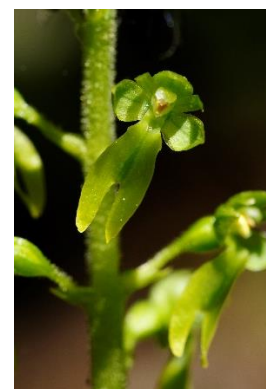
Listère ovale ( Liàstera ovata )