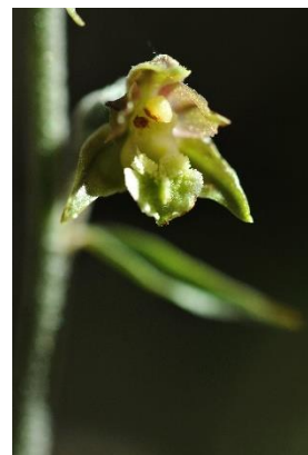
Epipactis à petites feuilles ( Epipactis microphylla )