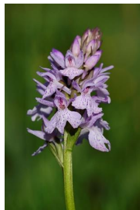
Dactylorhize de Fuchs ( Dactylorhiza de Fuchsii )