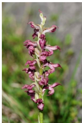
Orchis parfumé ( Anacamptis Coriophora subsp fragans )