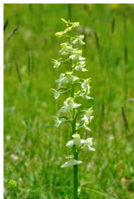
Platanthère verte ( Platanthera chlorantha )