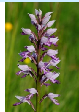
Orchis militaire ( Orchis militaris )