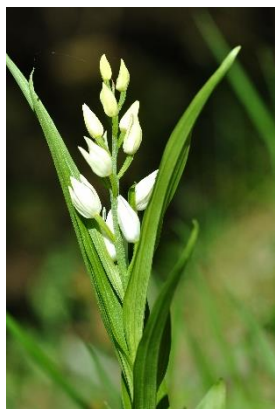
Céphalanthère à longues feuilles ( Cephalanthera longifolia )