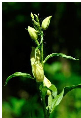
Céphalanthère de Damas ( Cephalanthera damasonium )