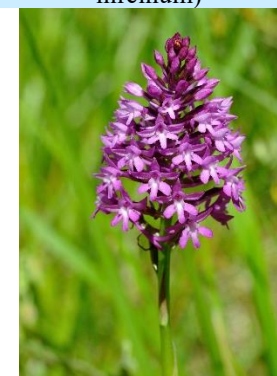
Orchis pyramidal ( Anacamptis pyramidalis )