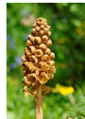
Neottie nid d'oiseau ( Neottia nidus-avis )