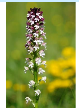
Orchis brûlé ( Neotinea ustulata )