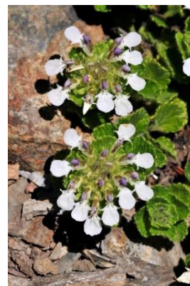
Germandrée des Pyrénées ( Teucrium pyrenaicum )