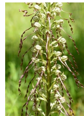
Orchis bouc ( Himantoglossum hircinum )