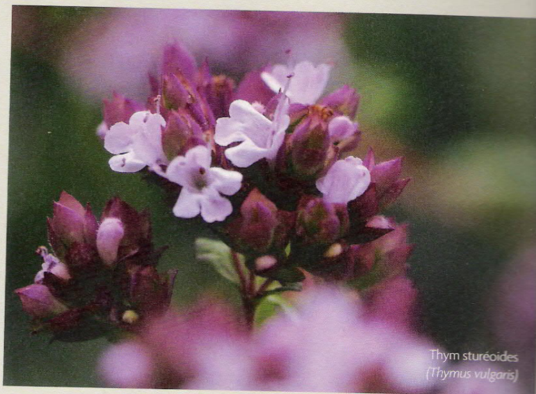
Thym sturéoides ( Thymus vulgaris )