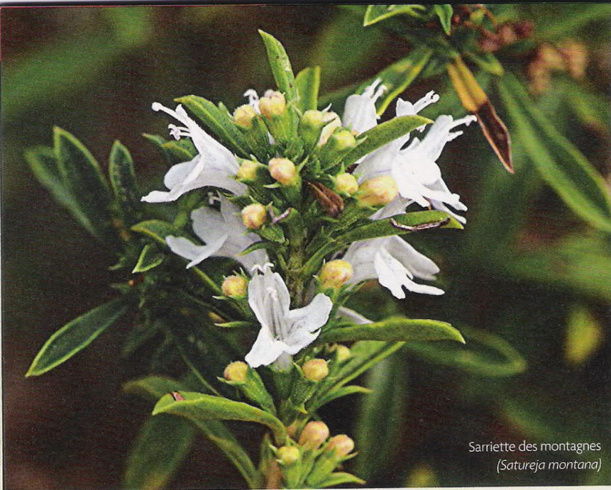
Sarriette des montagnes ( Satureja montana )