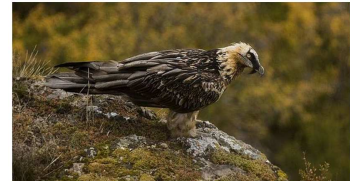
Cela ne représente qu'un peu plus de 0,3 jeune gypaète par couple.

Avec la naissance de treize gypaètes dans les Pyrénées en 2018, la sauvegarde de l'espèce est en bonne voie Environnement - Environnement