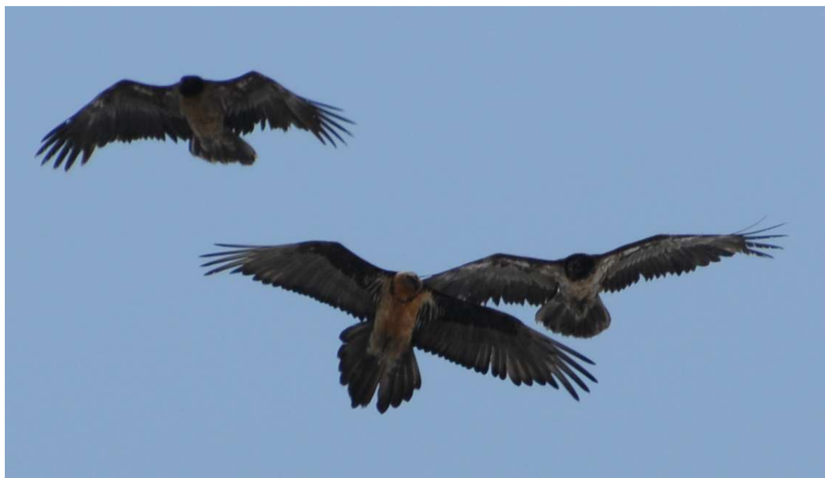
La femelle adulte Elizabeth (au centre) photographiée en 2011 en Aragon.