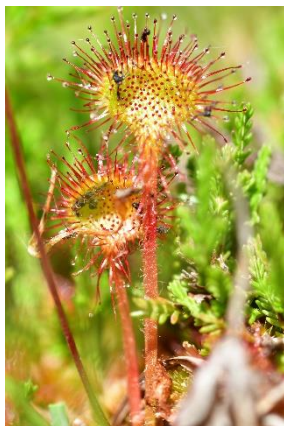
Drosera à feuilles rondes