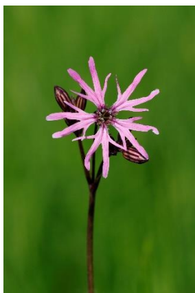
Lychnis fleur de coucou