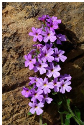
Erine des Alpes