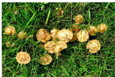
Marasme des Oréades (Boutons de guêtres)