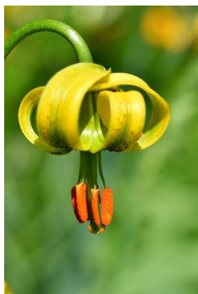
Lis des Pyrénées