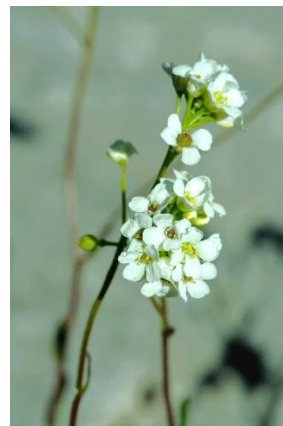
Kernère des rochers