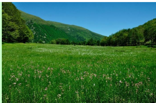
Cirque glaciaire et tourbière