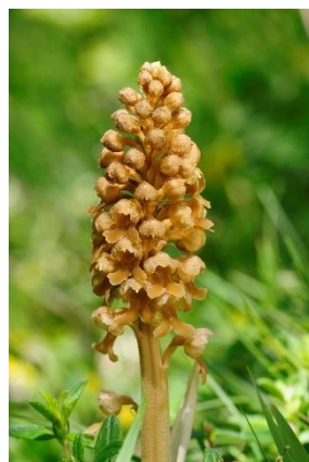
Neottie nid d'oiseau