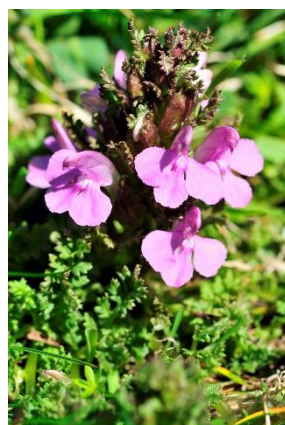
Pédiculaire des bois