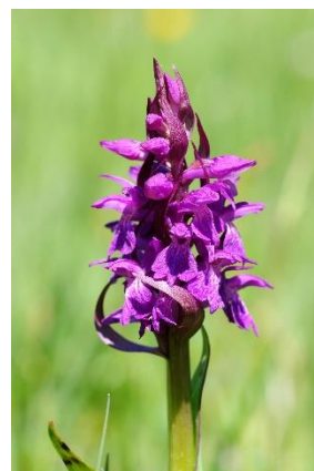
Orchis de Mai