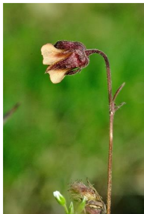
Benoite des ruisseaux